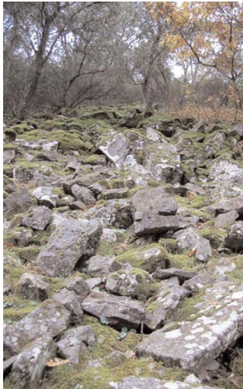
Pedrisa entre robles en la microreserva de la Garganta de las Lanchas

Ayuntamiento y Aguitur, se pretende facilitar el acceso y el conocimiento a los visitantes de una forma natural e integrada en el medio, instalando un refugio, un mirador paisajístico y otras equipaciones.