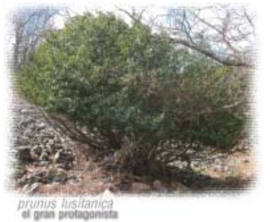
prunus lusitanica el gran protagonista