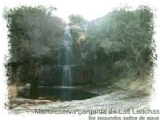
Microreserva Garganta de Las Lanchas los segundos saltos de agua

Es el valle del Gévalo, como territorio y marca turística de hoy, el equivalente al término municipal de Robledo del Mazo con sus 4 anejos de Las Hunfrías, Robledillo, Navatorri y Piedraescrita.