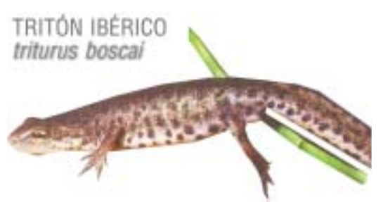
TRITÓN IBÉRICO triturus boscai

El espacio en sí, denominado Garganta de Las Lanchas y tematizada como Ruta de Ecoturismo con el número 2 dentro de las rutas temáticas del valle, se convierte en una de las microreservas más extensas de la región, y una de las más singulares en cuanto a su diversidad.